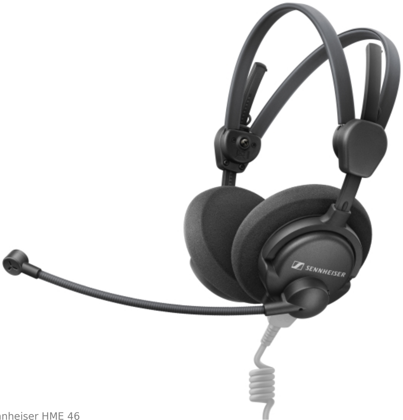
Sennheiser HME 46

Neumanns Premium Audio-Interface MT 48 wird auf der Messe sowohl mit der Music Mission für die Content Creation als auch mit der brandneuen Monitor Mission gezeigt. Letztere verwandelt das MT 48 in einen frei konfigurierbaren Monitoring-Controller. Neben Mono und Stereo beherrscht die Monitor Mission auch Surround- und Immersive-Audio-Formate. Das MT 48 wird auf der NAB ebenfalls für die Präsentation von Neumanns KH-Linie von Studiomonitoren sowie den geschlossenen NDH 20 und offenen NDH 30 Kopfhörern eingesetzt.