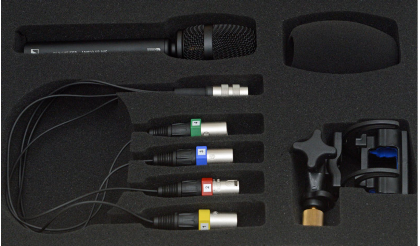
Foto oben mit abgenommenem Schutzkorb), in Anordnung eines regulären Tetraeders, an. Die Mikrofonkapseln sind relativ dicht beieinander angeordnet. Als Mikrofonkapseln kommen aufeinander abgestimmte Sennheiser dauerpolarisierte Electret-Kapseln des Typs KE 14 mit Nierenrichtcharakteristik zum Einsatz.

Unten am Mikrofongehäuse ist eine 12-poliger DIN12M-Steckverbindung mit Schraubverriegelung vorhanden. Geliefert wird das Mikrofon mit einem Windschutz sowie eine Kabelpeitsche von 12-pol. DIN auf vier XLR-Steckern und einer elastischen Halterung (s. Abb. unten).