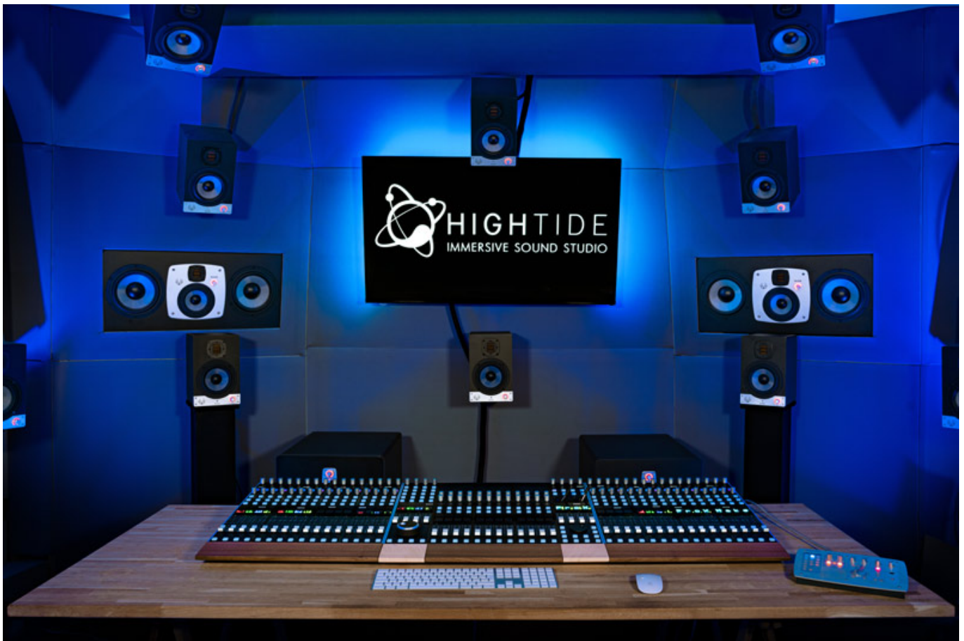
Foto: Regie B mit MakeProX-Konsole

Bei uns rendert der Dolby Atmos Renderer 14 diskrete Lautsprecher Signale (9.1.4) und zwei Kopfhörersignale (Binaural) die über MADI an einen Fraunhofer SpatialSound Wave Renderer geschickt werden. Dieser Renderer korrigiert zum einen die Lautsprecher in Zeit und Frequenzgang, zum anderen dient er als Monitor-Controller und ermöglicht es, einzelne Lautsprecher solo zu schalten oder zu muten. So kann der Dolby Atmos Renderer die ganze Zeit im Hintergrund bleiben. Die diskreten, korrigierten Lautsprechersignale gelangen dann über MADI auf einen Ferrofisch A32 AD/DA-Wandler und werden auf die entsprechenden Lautsprecher verteilt. Aktuell ist das bei uns eine 9.1.4-Konfiguration mit zwei Subwoofern am LFE-Kanal.