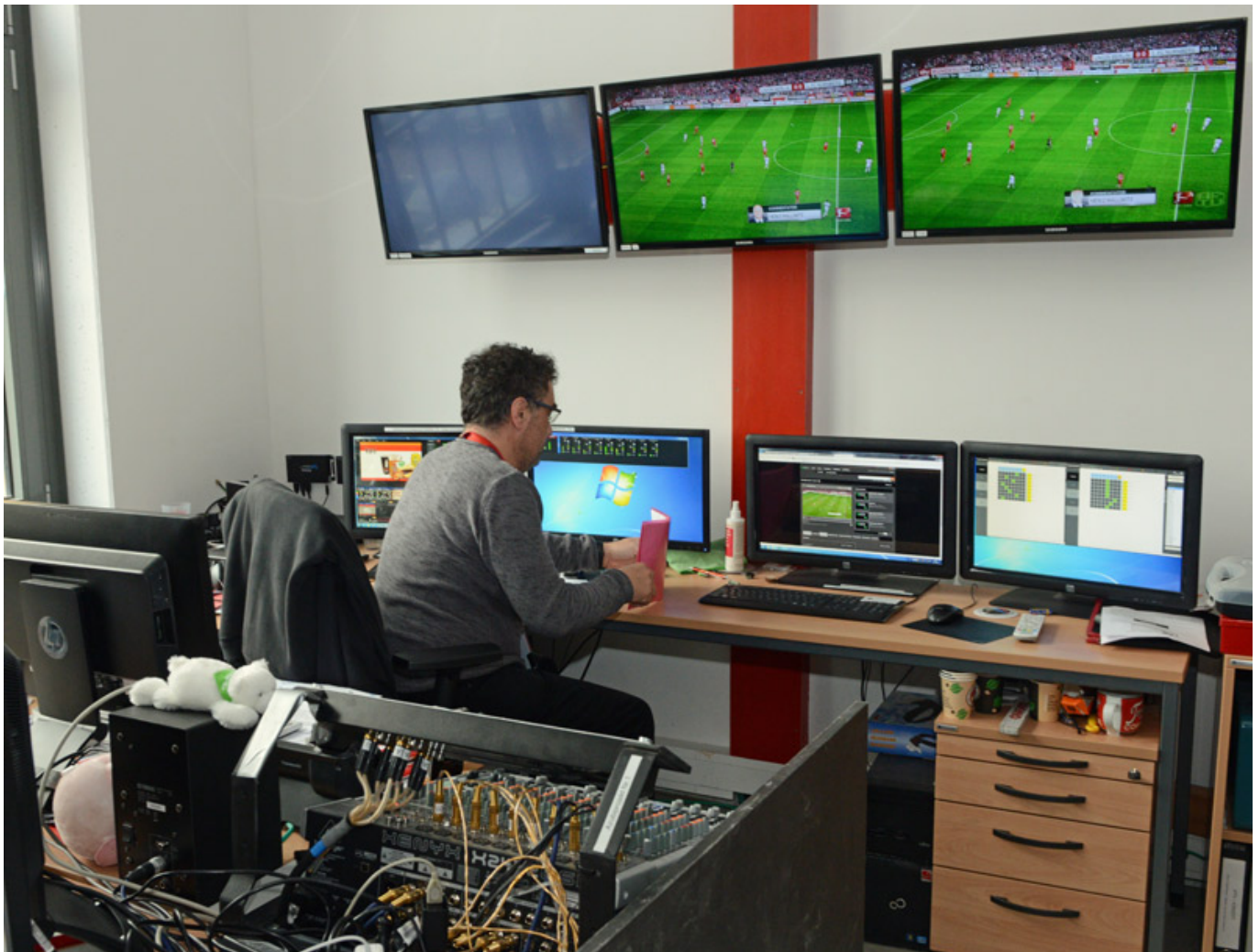
[Abb. oben: Hausregie - hier laufen alle Fäden zusammen und von hier ist die